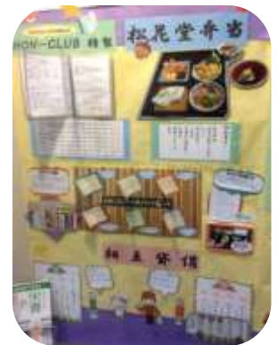
▲ユニークな企画を紹介 するポスター発見♪