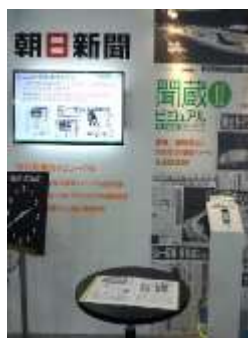
▲朝日新聞・間蔵 体験コーナー