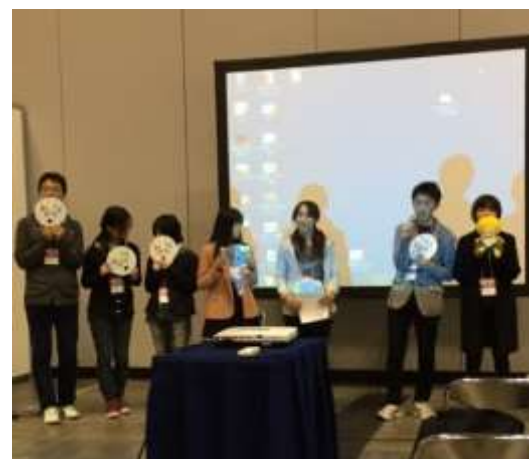
▲ライちゃんプレゼンタイム！

このグランプリは、応募された全国の図書館キャラクターの中から、全来場者の投票で優勝を決める大会です！私たち図書館サポーターのマスコットキャラクター「ライブラリアン 13 世（通称：ライちゃん）」も参戦しましたが、惜しくも賞は逃しました ><