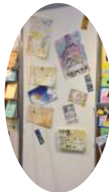
▲デザインに凝った ポスター展示も！